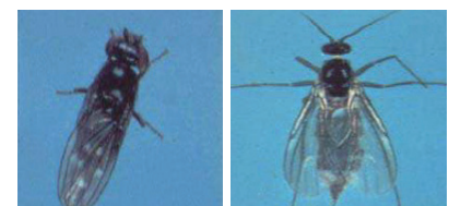
Mouche des rivages adulte (à gauche) et mouche fongicole (à droite). 1

Le cycle de vie des mouches des rivages consiste en un œuf, trois phases larvaires, une puppe et un adulte. Les femelles pondent 300 à 500 œufs dans des zones d'accumulation d'algues telles que les milieux de culture, les bancs et le sol. Les œufs éclosent pour donner naissance à des larves marron-jaunâtre avec deux tubes respiratoires fourchus à pointes sombres. Les larves se trouvent à la surface ou juste en dessous de la couche supérieure du milieu de culture. Le développement d'un œuf à l'état adulte nécessite environ 4 semaines, en fonction de la température. Les mouches des rivages ont de multiples générations par an.