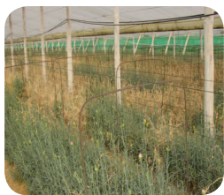
Culture naturellement infectée avec Fusarium oxysporum f. sp. dianthi