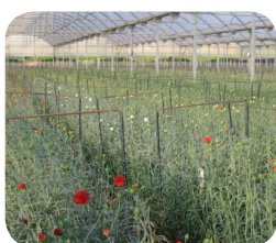
Serre commerciale traitée avec Asperello